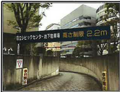
日立シビックセンター地下駐車場（市営）