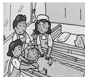
自宅ベッドの横で入浴を可能にしました

デベロは、さらなる挑戦として、広い分野から技術・情報を取り入れた製品づくりを目指しております。